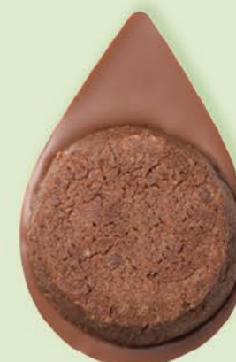
BISCUIT BROWNIE Chocolat au lait 35% de cacao