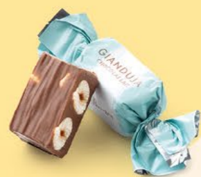
Chocolat au lait

Imaginez notre fameux praliné gianduja dans lequel sont plongées 2 noisettes entières caramélisées. L'alliance exquise du croquant et du fondant.