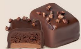
Duo gianduja noisettes et crème au beurre chocolat noir