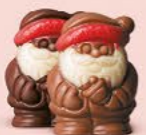
Praliné et éclats de nougat ou praliné et éclats de noisettes caramélisées