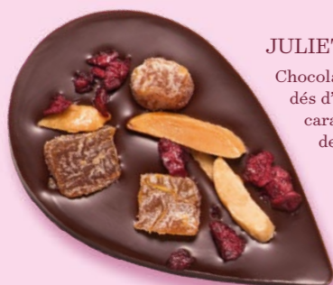
JULIETTE & TOM Chocolat noir 60% de cacao, dés d'abricots secs, amandes caramélisées et morceaux de cerise

BOITE DE 285 G NET 26 JULIETTES ASSORTIES 4 RECETTES