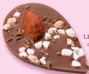
LE SONGE DE JULIETTE Chocolat au lait 35% de cacao, amande, éclats de nougat, brins d'anis