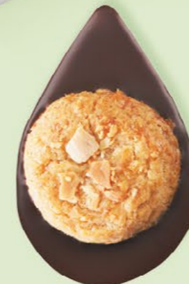
BISCUIT AMANDES Chocolat noir 60% de cacao