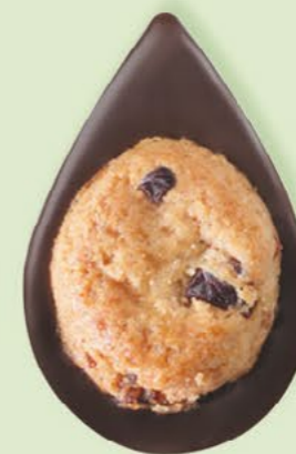
BISCUIT CRANBERRIES Chocolat noir 60% de cacao