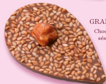
GRAINE DE JULIETTE Chocolat au lait 35% de cacao, sésame, noisette caramélisée