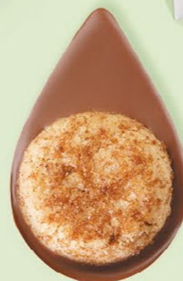
BISCUIT NOISETTES Chocolat au lait 35% de cacao