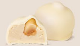
Crème au beurre à la vanille et sa noisette caramélisée

Un grand classique revisité pour apporter du croustillant... et de l'inattendu. Lequel va vous faire fondre en premier ?