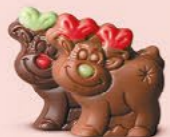
Praliné avec éclats de noisettes torréfiées ou praliné avec éclats de crêpe dentelle