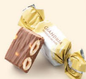
Nougat au miel