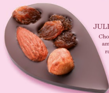
JULIETTE IN THE CITY Chocolat noir 70% de cacao, amande, noisette, raisins secs