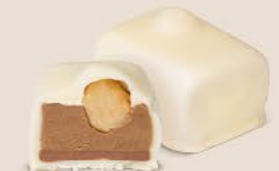
Duo praliné noisettes et crème au beurre au café, avec sa noisette caramélisée