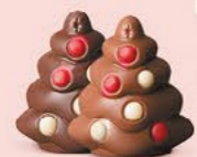
Praliné et sucre pétillant ou praliné tendre