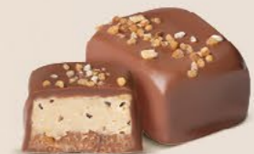
Duo gianduja noisettes et crème au beurre avec éclats de fèves de cacao et de noisettes